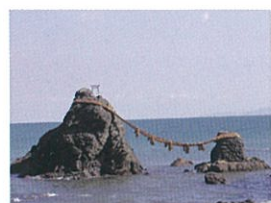
浜辺屋 〒517-0015 三重県鳥羽市小浜町272-58 TEL 0599-25-2259 ★ランチタイム11:30~13:30