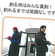
釣る時はみんな真剣! 釣れるまでは笑顔なしです!

10:00 出発 ポイント所要時間約15~30分 釣り開始! 竿を投げ続けるもよし、のんびりと春の日差しを楽しむもよし... 13:00 or 16:00 マリーナ帰港