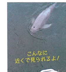
こんなに近くで見られるよ!

三河湾には多くのスナメリの目撃例があります。海面が静かなときに潮目付近を通ると突然その姿を現し、驚かせてくれます。海面に出てきて大きく息を吸う音が聞こえることもしばしばです。大自然との遭遇を体験してください。 春先から初夏にかけては西浦半島から佐久島の間にかけて出会う機会が多く、夏から秋にかけてはラグナマリーナの前から姫島、西浦半島にかけての出会いが期待できます。